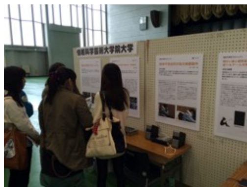
図 4 福祉機器フェアの様子