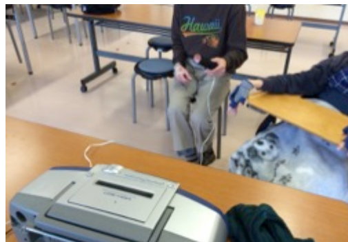
図 5 ふれあいの家での様子