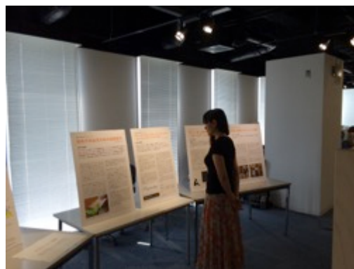
図 2 オープンハウスの展示