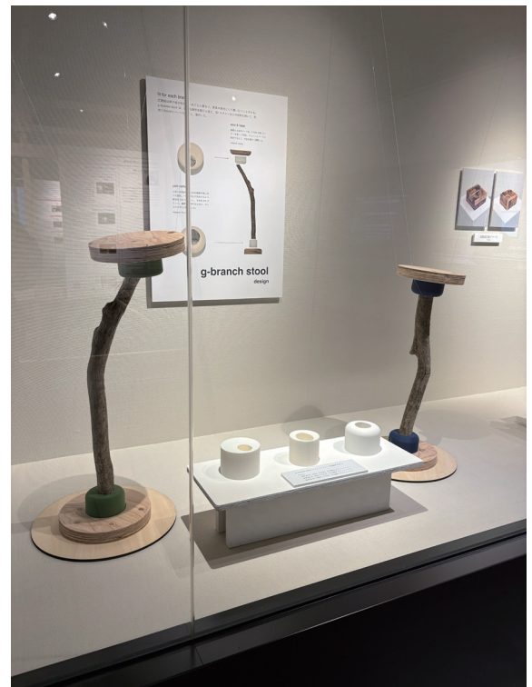
「飛騨家具ーパラメトリックデザイン」の取り組み「g-branch stool」