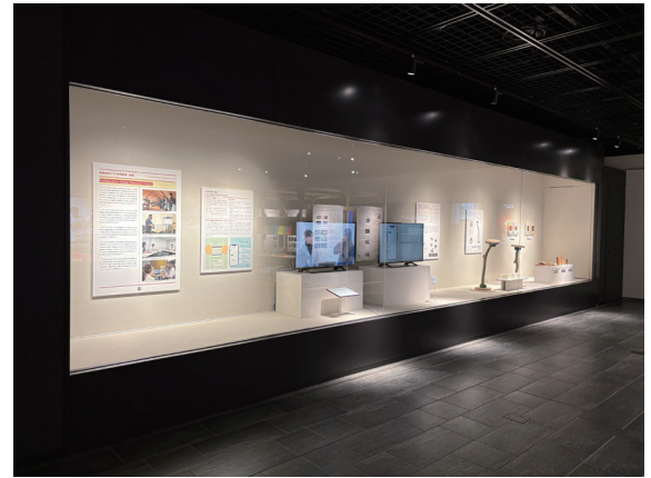
GALLERY GIFU での展示の様子

3年間の活動について詳しくは「情報科学芸術大学院大学紀要 第17巻」へ投稿したので、紀要をお読みください。紀要に掲載していない内容を以下に示す。