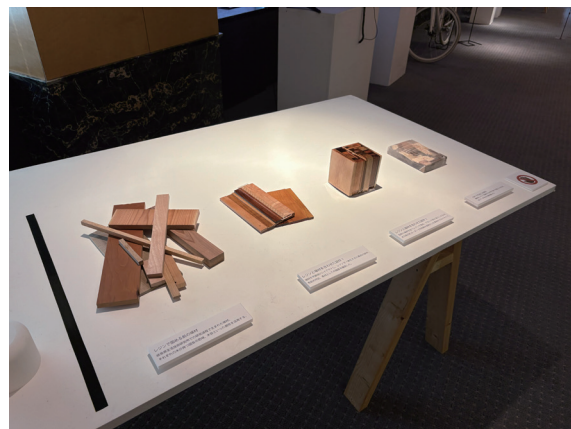
「飛騨家具ーパラメトリックデザイン」の取り組み「広葉樹 x レジン x CNC」