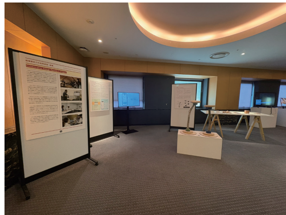
プロジェクト研究発表会の展示