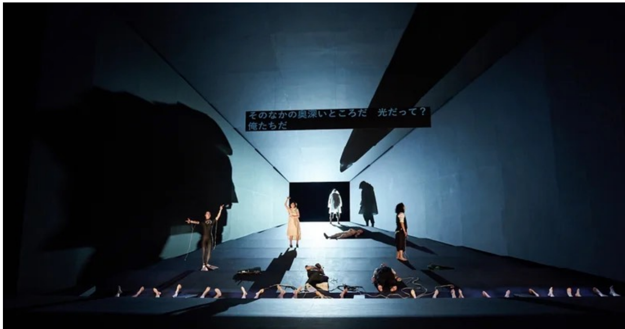
KAAT 神奈川芸術劇場、地点がイエリネク「ノー・ライト」マルチリンガル再演

図書館長としてIAMASのウェブサイトにおける動画アーカイブ構築の準備など前向きに取り組んだ。今年は学外での作品発表は多くはないが、規模の大きなプロジェクトが並んだ。